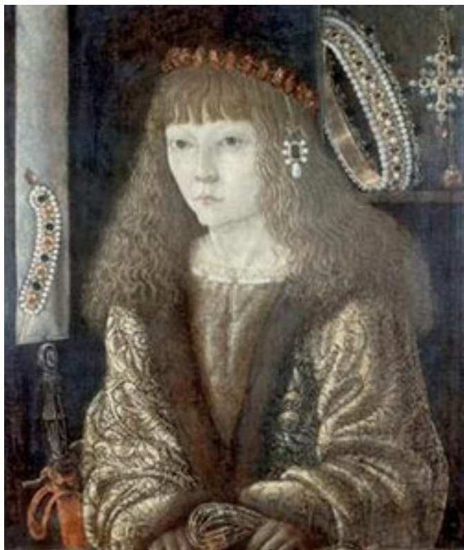
1470-1475: A portrait of a woman, likely a queen or noblewoman, wearing a crown and a fur-lined garment. The image is a reproduction of a painting by Hans Memling, depicting a woman in a gold and brown robe with a fur collar, wearing a crown and a large earring. She is holding a book or a scroll in her hands. The background is dark and indistinct.