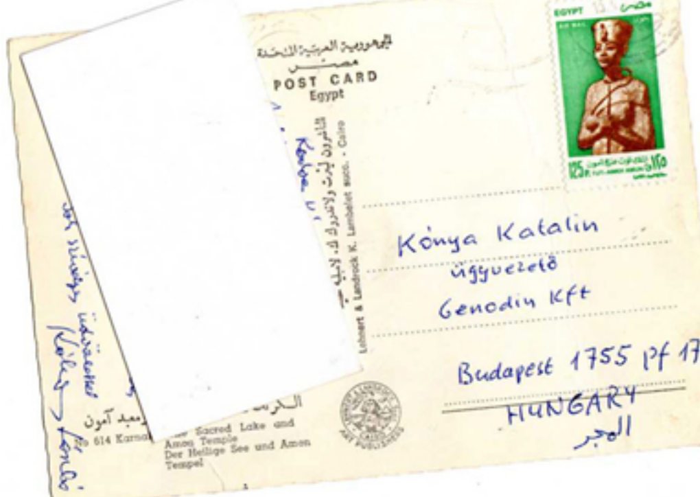
Képek: Katalin Könyvkereskedés, Budapest, 1965. július 29. - Budapest, 1965. július 29. - Budapest, 1965. július 29.